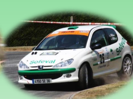
206 RC (Gr.A)