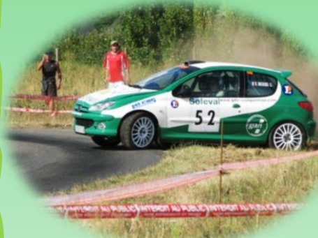
206 RC (Gr.N)